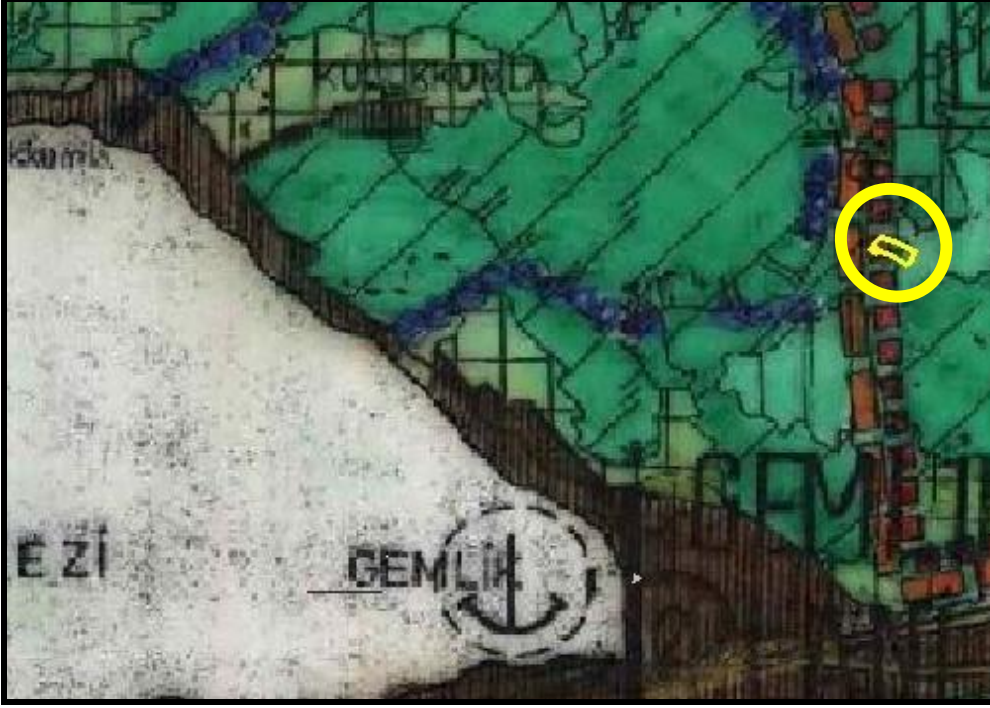
Şekil 2: Onaylı 1/100.000 Ölçekli Plan Örneği